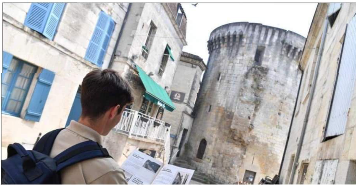
L'Écho de Vésone nous emmène aux pieds de la tour Mataguerre et dans toute la ville pour la redécouvrir de manière ludique.

Le carton entre mes mains, je me pose sur mon bureau dans un espace calme, à tête reposée. Je l'ouvre et découvre les consignes expliquées sur une immense carte posée