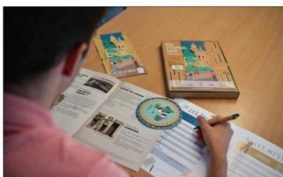
Installé au calme, il m'aura fallu un peu plus d'une heure pour résoudre l'enquête.