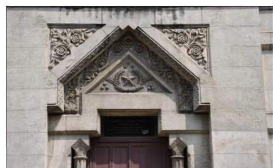
C'est une étoile qu'il y a sur le bâtiment des francs-maçons.