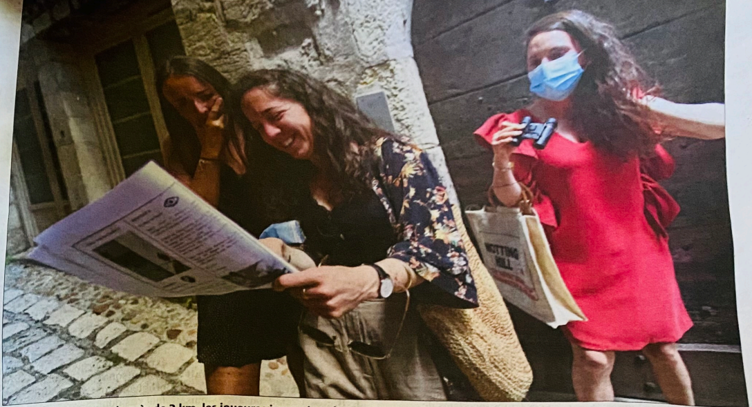
À travers un parcours de près de 2 km, les joueurs viennent en équipe déjà constituée de une à dix personnes, pour tenter de trouver un trésor qui se cache dans le centre-ville de Périgueux.