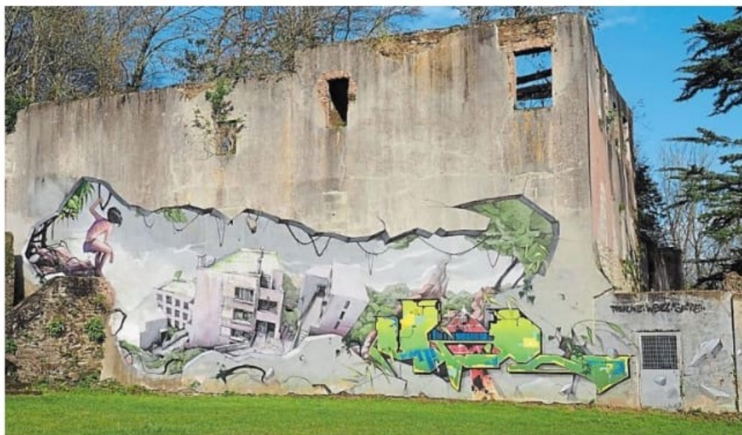
Sur les rives de la Penfeld à Brest, la friche urbaine située après la porte de l'arrière-garde recèle de nombreux trésors. Comme cette fresque géante de Pakone, Wen2 et Shire : « Mowgli surplombant une ville abandonnée ».

surprendre. Dans le Finistère, on voit surtout des graffitis et des fresques murales. Alors que les arts urbains, ce sont aussi des mosaïques, des installations, des collages... C'est un peu une chasse au trésor. Si on a l'œil aguerrri, on repère les pochoirs. À Brest, il y a des cocottes partout. La basse-cour s'est agrandie ! C'est l'œuvre de Jean-Yves Le Fourn, un artiste qui a son atelier rue Bruat.